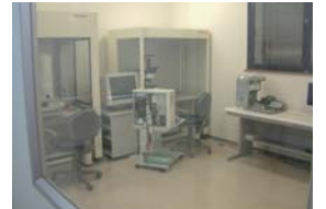
クラス100クリーンルーム

高密度メディアのデータ復旧に必要な不可欠な「クラス100クリーンルーム」「レーザー顕微鏡」「1998年のサービス開始時から絶え間なく独自に開発した「リカバリーツール群」を擁し、困難な復旧に対応しています。