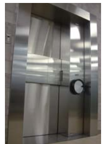
耐火耐震大型金庫の厚さ16cm扉

データ復旧作業を受注するにあたって、お客様と「守秘義務契約」を結びます。さらに、当社内では、全従業員とも「守秘義務契約」を交わし、守秘意識を徹底。常に従業員の倫理観の向上に努めています。また、お客様の大切なデータは、警備会社との連携による24時間警備体制の下、セキュリティカードと監視カメラで社内への出入りをチェック。厚さ16cmの扉を有した大金庫の中に厳重に保管されています。