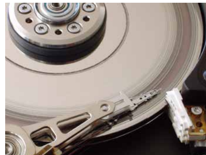
障害を受けたハードディスク

Windows®(10、8、7、Vista、XP、2000、NT、98、Me、95、3.1)、Mac(OS、OS X)、iOS、AndroidOS、UNIX各種、Linux各種、DOS(MS、DR、PC等)、その他(Free BSD、Netware、組込OS、特殊OS等)