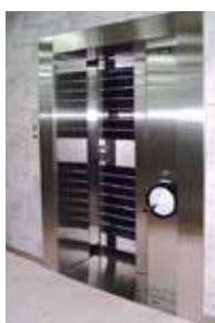
耐火耐震大型金庫の厚さ16cm扉

データ復旧作業を受注するにあたって、お客様と「守秘義務契約」を結びます。さらに、当社内では、全従業員とも「守秘義務契約」を交わし、守秘意識を徹底。常に従業員の倫理観の向上に努めています。また、お客様の大切なデータは、警備会社との連携による24時間警備体制の下、セキュリティカードと監視カメラで社内への出入りをチェック。厚さ16cmの扉を有した大金庫の中に厳重に保管されています。