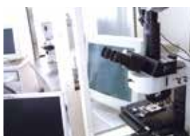
クラス100クリーンルーム

高密度メディアのデータ復旧に必要な不可欠な“クラス100クリーンルーム” “レーザー顕微鏡” 1998年のサービス開始時から絶え間なく独自に開発した“データ復旧ツール群”を擁し、困難な復旧に対応しています。