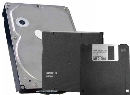
(左から HDD、磁気テープ、フロッピーディスク)